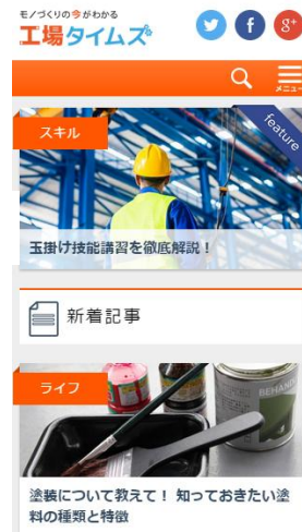
スマホ・タブレット閲覧時の画面